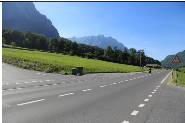
Blick Richtung Norden