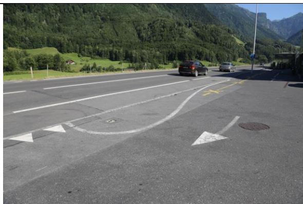
Blick nach Süden, keine Einschränkungen