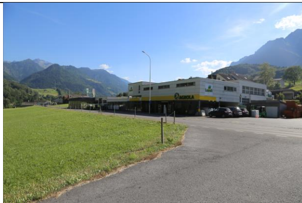
Blick Richtung Süden