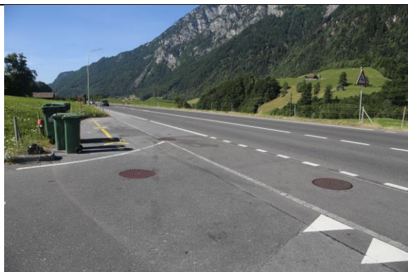
Blick nach Norden