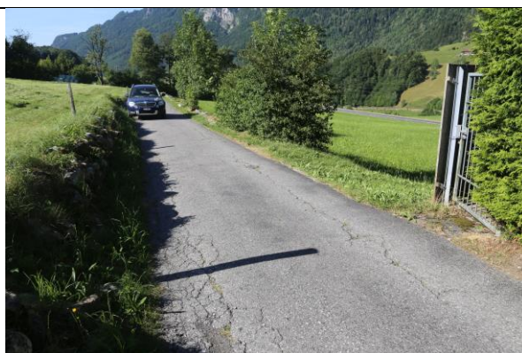
Blick Richtung Norden, aufgrund der bergseitigen Trockenmauer ist die Einfahrt ab der Alten Landstrasse / Horgenberg räumlich begrenzt.