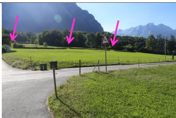
Blick bergwärts, die Trockenmauer weist an mehreren Stellen Lücken auf, welche eine Einfahrt zum Standort MI1 ermöglichen