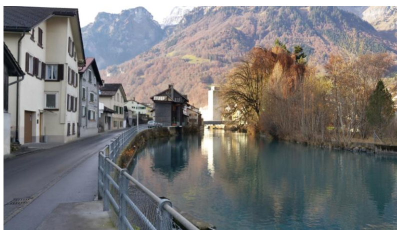
Abb.) Beispiel dicht überbaute Gebiete (Linth, Schwanden)